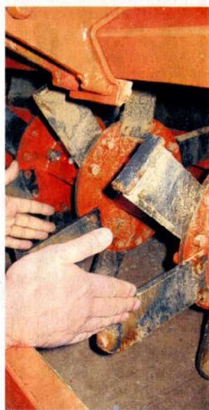
Zwei Maschinen zur Schlitzdrainage hat Diez entwickelt und patentieren lassen. Breite und Tiefe sind dabei unter anderem variabel einstellbar.